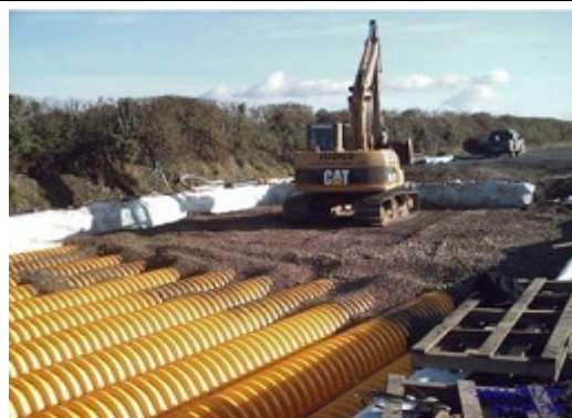
8. Warstwa tłucznia zgodna z projektem, minimum 15 cm