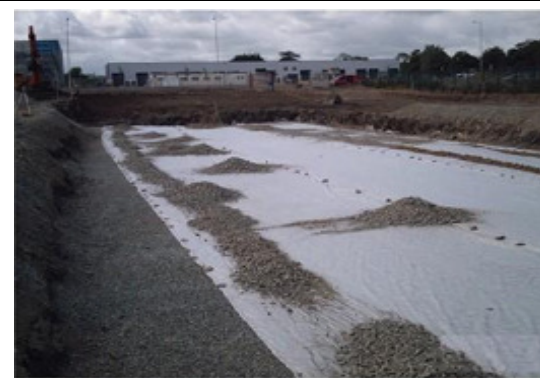
9. Układamy geowłókninę, a nad nią wykonujemy zasypkę, którą zagęszczamy co 15 cm