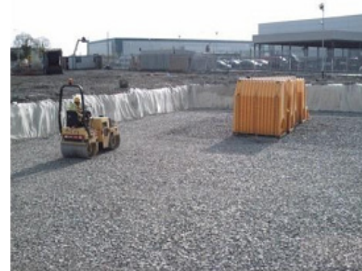
3. Tłuczeń łamany zgęszczamy do min. 95% gęstości standardowej Proctora