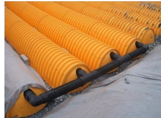
6. Montujemy rurę dystrybucyjną