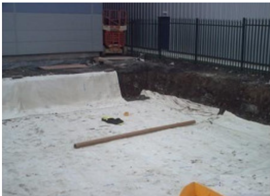
1. Wykonujemy wykop, następnie wykładamy wykop geowłókniną