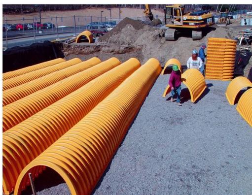
4. Układamy ciągi komór drenazowych (odstęp między rzędami minimum 15 cm)