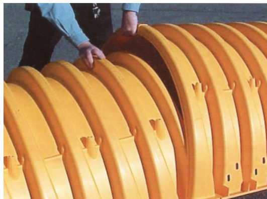
5. Dwie sąsiednie komory powinny być połączone na zakładkę