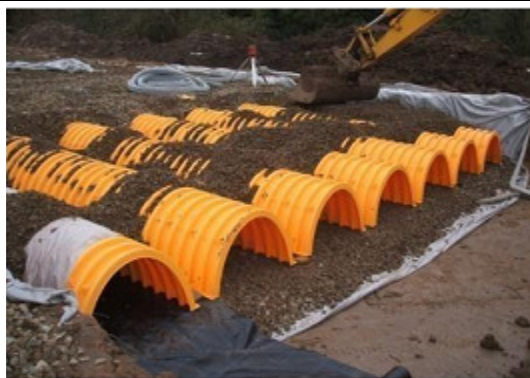
7. Przykrycie systemu wykonujemy za pomocą obsypki z tłucznia