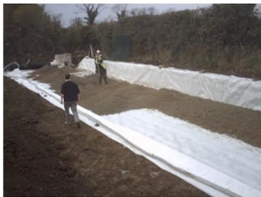
2. Na dnie umieszczamy warstwę minimum 15 cm obsypki z tłucznia (uziarnienie 31÷63 mm)