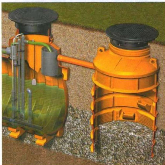
Rys. 2. Studnia chłonna jako element instalacji firmy Kessel 16

Skrzynka występuje w dwóch postaciach. W wersji podstawowej jest prostą konstrukcją prostokątną ażurową, o stosunkowo małych rozmiarach (fot. 2). Odpowiednie rozwiązanie ścian pozwala uzyskać stosunkowo dużą powierzchnię kontaktu zgromadzonej wody z podłożem. Ze względu na niemożność skutecznego