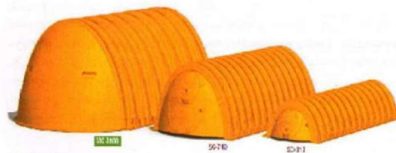
Fot. 5. Komora w wersji zmodyfikowanej – np. komory drenażowe SC 13 (wypływ wyłącznie przez dno)

Przed montażem należy sprawdzić, czy podczas transportu lub rozładunku nie uszkodzono elementów systemu. Nie wolno montować uszkodzonych elementów ani ich „naprawiać” we własnym zakresie.