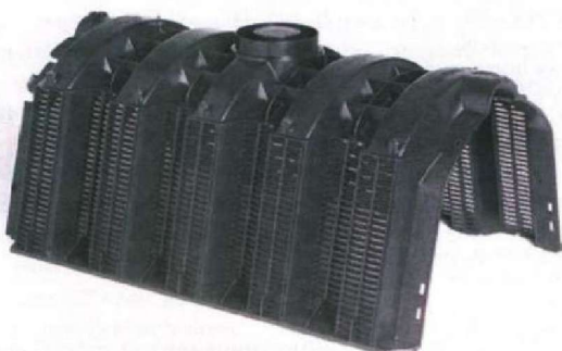
Fot. 4. Komora w wersji podstawowej, np. tunel rozsączający 13

Zagadnienia montażu zostaną przedstawione na przykładzie komór zmodyfikowanych do zagospodarowania wody deszczowej z autostrad, dróg i parkingów, czyli tam, gdzie występują duże obciążenia (tab. 2). Zasadne jest omówienie szczegółowo prac montażowych (na podstawie materiałów producenta komór drenażowych SC 13 ).