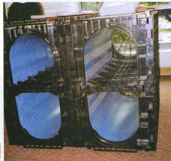
Fot. 3. Skrzynka zmodyfikowana

Komory występują w dwóch postaciach, w wersji podstawowej (fot. 4) są konstrukcją o małej wysokości i relatywnie niewielkiej pojemności jednostkowej z wypływem przez dno i ściany boczne, co umożliwia efektywną infiltrację do gruntu. W warunkach istotnych obciążeń od transportu (tab. 3) – względnie od naziomu – nie jest to rozwiązanie dostatecznie bezpieczne – szczególnie niebezpieczne są obciążenia od samochodów ciężarowych. Cechą charakterystyczną wszystkich komór jest duża powierzchnia kontaktu z podłożem – co najmniej równa rzutowi dna. Komory w wersji