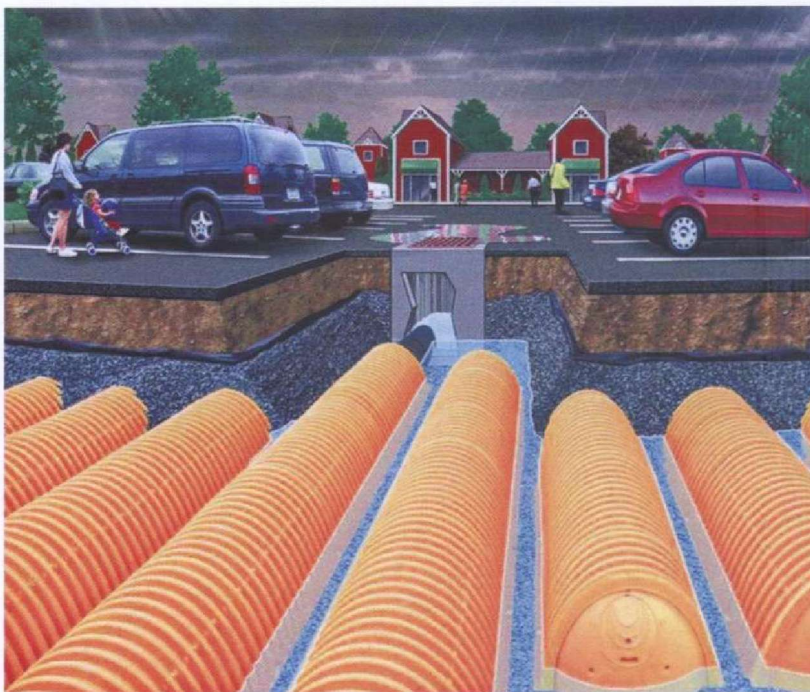
Rys. 1. System komór drenazowych SC (parking)

Wodę deszczową możemy także powierzchniowo retencjonować i odparowywać, a także wykorzystywać zretencjonowane wody deszczowe do podlewania zieleni, spłukiwania ulic