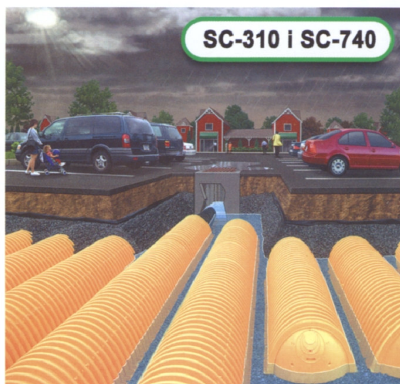
SC-310 i SC-740